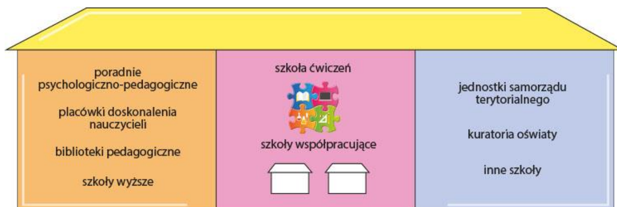
Rys. 2. Schemat szkoły ćwiczeń

Szkoła ćwiczeń to zespół zaplanowanych działań szkół i placówek oraz instytucji służących wspieraniu procesu uczenia się nauczycieli oraz studentów. Szkoła ćwiczeń to placówka, gdzie przyszli nauczyciele będą doświadczać praktycznej weryfikacji teorii, z którą spotykają się podczas studiów, a obecni nauczyciele będą doskonalić swój warsztat pracy. To tam student zmierzy się – pod kierunkiem swojego opiekuna – z praktyką pedagogiczną: zarówno w zakresie dydaktyki, jak i wychowania. To tam nauczyciele będą rozwijać swój warsztat pracy i dzielić się swoimi pomysłami z innymi nauczycielami. Na rys. 2 został przedstawiony schemat szkoły ćwiczeń, czyli samych szkół oraz placówek/instytucji wspierających ich pracę.