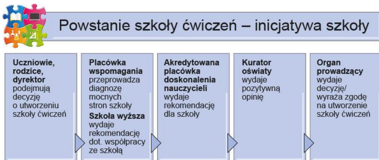
Rys. 1. Kolejne kroki umożliwiające zgłoszenie do pilotażu i udział w nim

Działania umożliwiające zgłoszenie do pilotażu i udział w nim przedstawia także rys. 1.