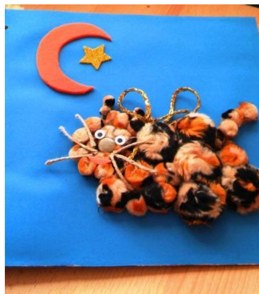
Kolejne strony książki: tęcza i gwiazdy, ptaszki w gnieździe, kot