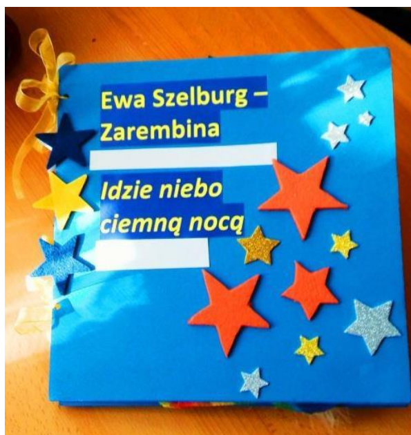
Okładka książki „Idzie niebo ciemną nocą”