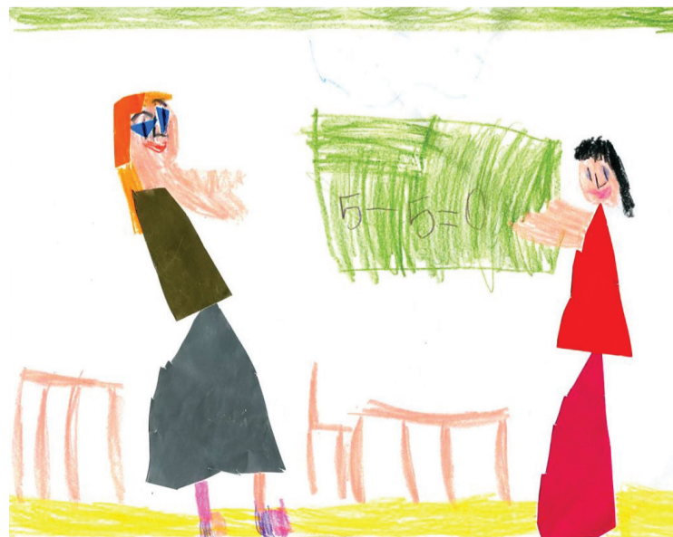
Rysunek uczennicy klasy I Zespołu Szkół nr 27 Szkoła Podstawowa nr 13 w Kielcach

wychowawcy włączają starszych uczniów do pomocy najmłodszym. W większości gmin samorządy dobrze przygotowały szkoły na przyjęcie sześciolatek. Placówki są najczęściej wyposażone w liczne pomoce dydaktyczne, gry i zabawki edukacyjne oraz sprzęt sportowy. Ponadto w każdej szkole uczniowie mogą korzystać z komputera i internetu.