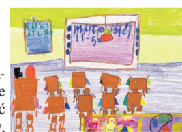
Rysunek uczennicy klasy I SP nr 1 w Wyszкові

W szkole lubię wszystkie zajęcia. W przedszkolu nie mogłyśmy się tak dużo uczyć jak tutaj. Ciągłe coś jedliśmy, a teraz sama decyduje, kiedy i co chcę jeść. W przedszkolu było trochę nudno, a w szkole można nauczyć się dużo nowych rzeczy. Nauczyłam się już dalej liczyć do 11, na przykład 5+6. Z ćwiczeniami radzę sobie bardzo dobrze. Kiedy dzieci wykonują jeszcze to samo zadanie, ja już chcę wykonywać kolejne, bo je skończyłam. Robię je szybciej niż inne dzieci. Lubię nowe