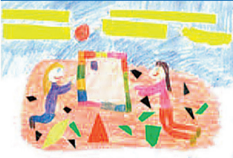
Rysunek uczennicy klasy I Szkoły Podstawowej nr 13 w Kielcach